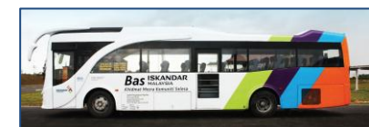
Bas Iskandar Malaysia