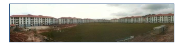
PRISMA (Perumahan Rakyat Iskandar Malaysia)