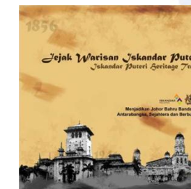
Jejak Warisan Iskandar Puteri