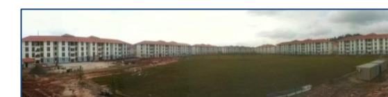
PRISMA (Iskandar Malaysia Public Housing)