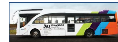
Bas Iskandar Malaysia