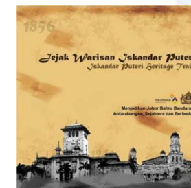
Iskandar Puteri Heritage Trail

COME AND GET TO KNOW MORE ABOUT ISKANDAR MALAYSIA PROJECTS